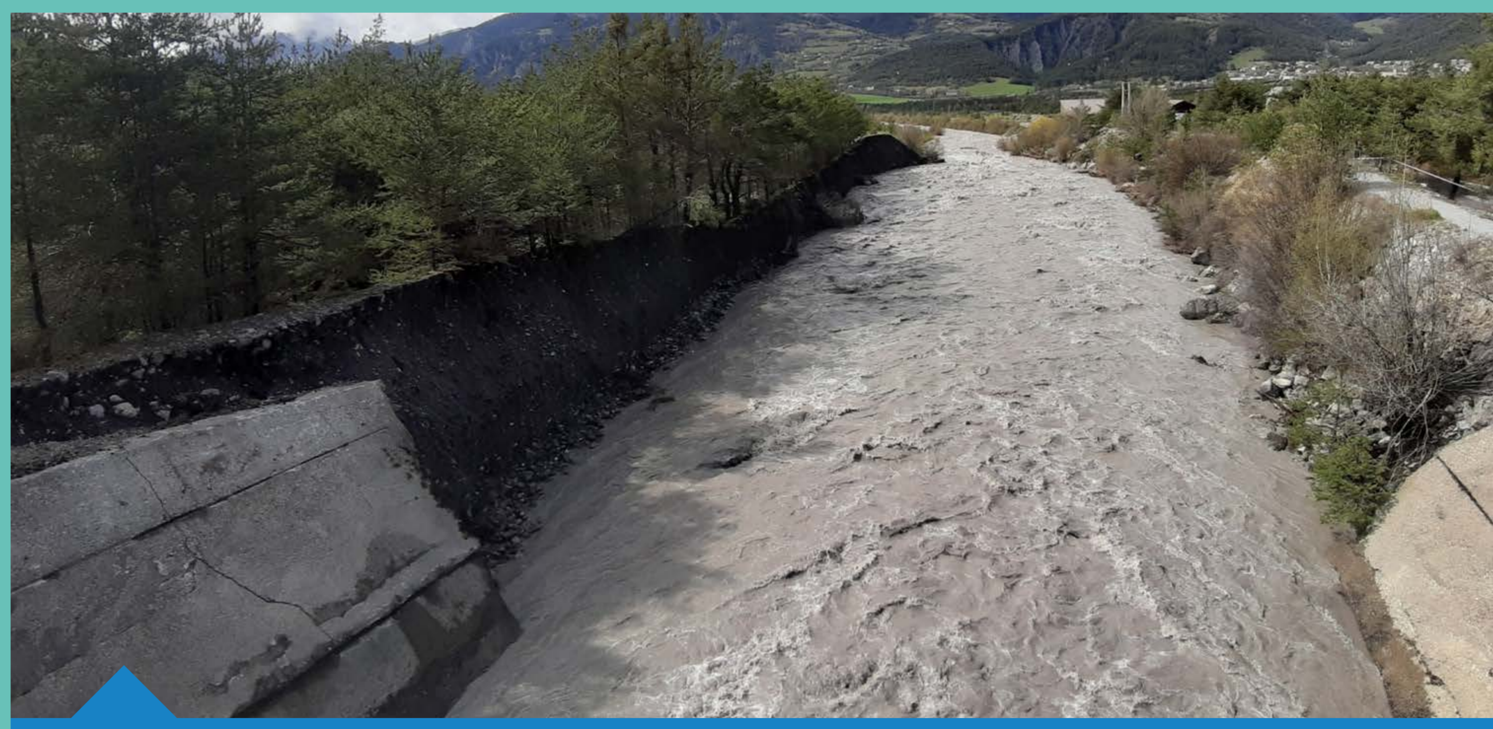
Crue du Bachelard le 05 mai 2021(04) - commune d'Uvernet-Fours

Mais aussi inondations de plaine : rivière Durance en aval du barrage de Serre-Ponçon