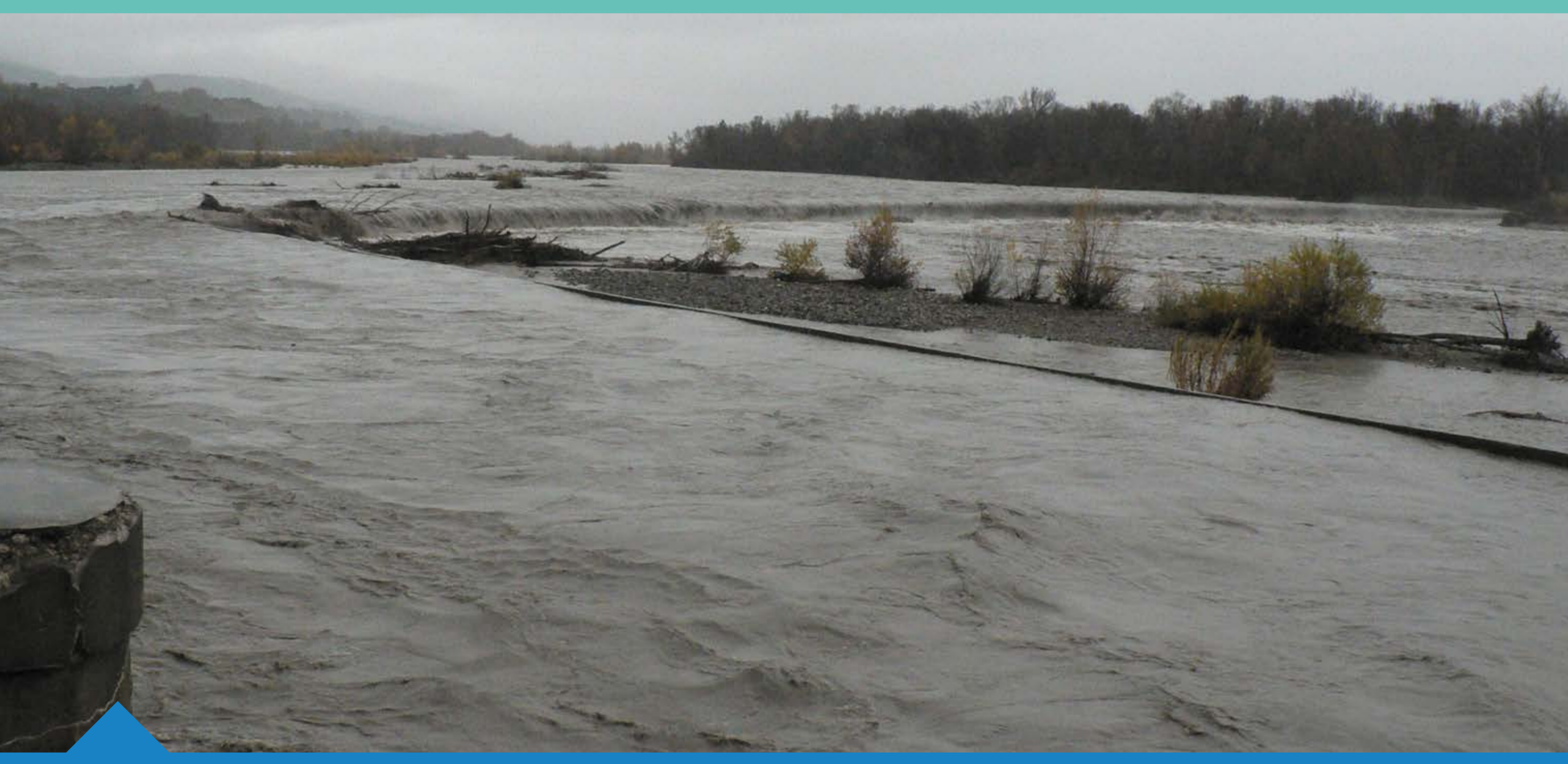
Crue de la Durance novembre 2011 - commune de la Brillanne