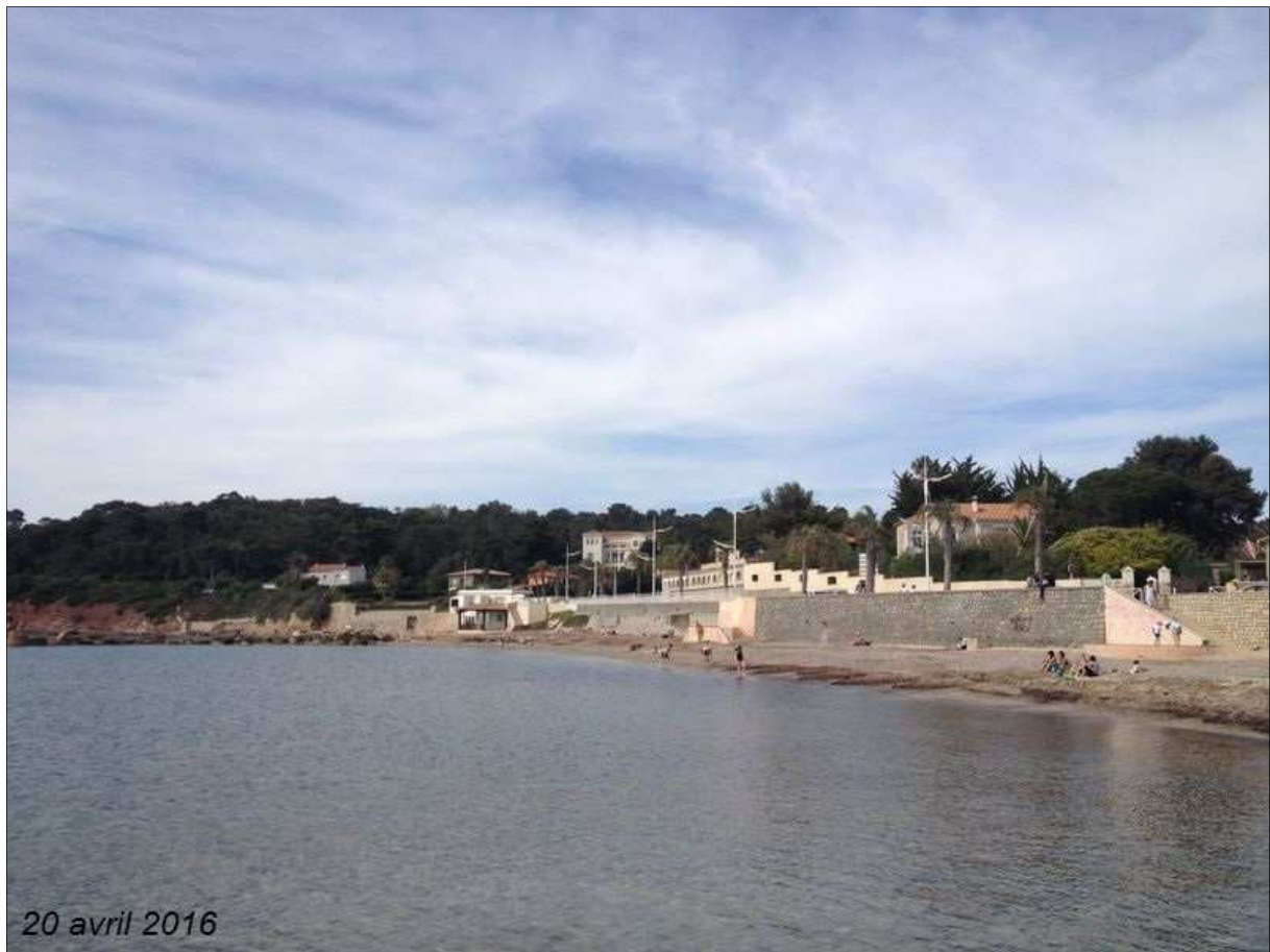
Prise de vue n° 2 (Zoom):