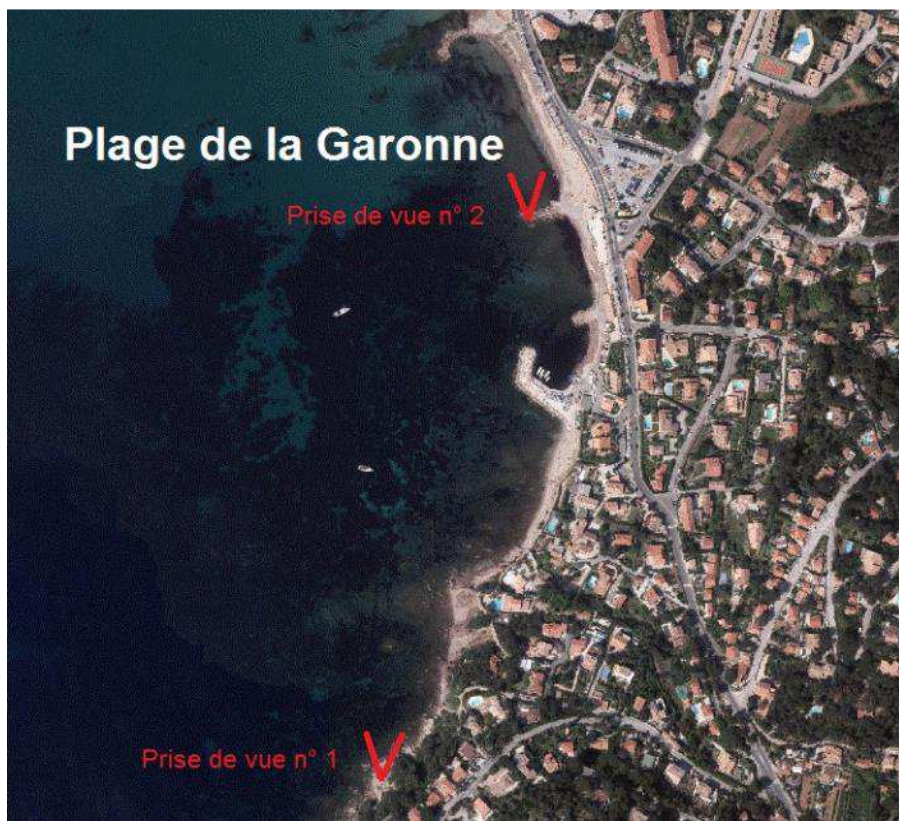
Prise de vue n° 1