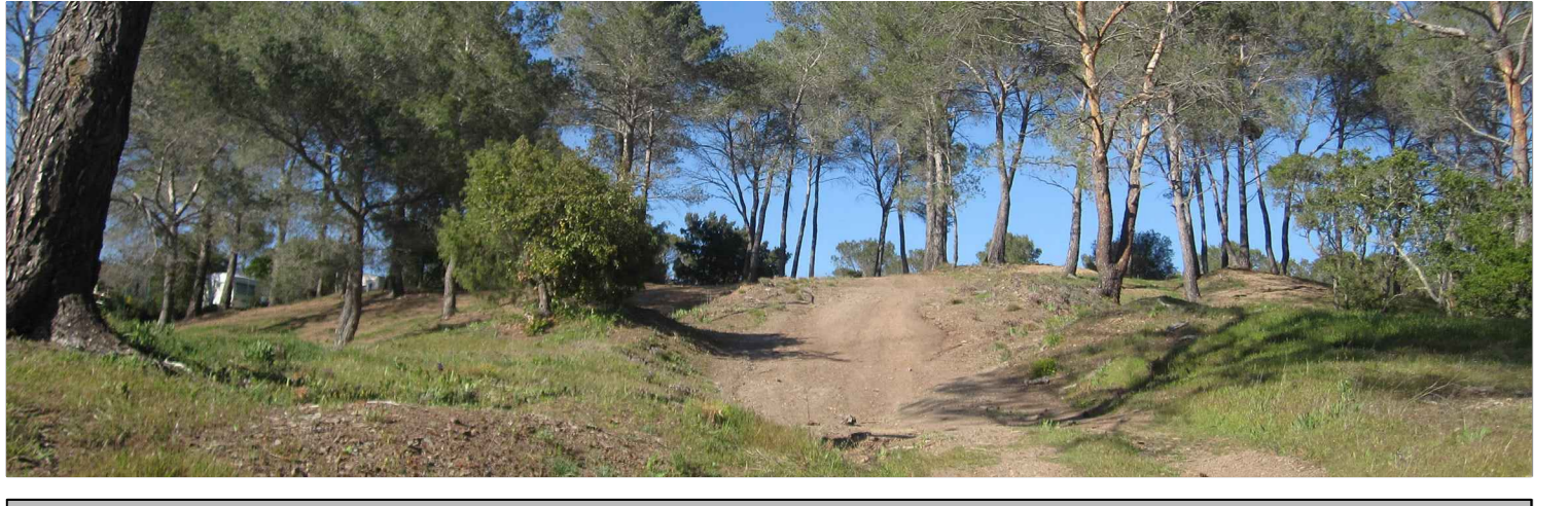
Vue en Plan F13