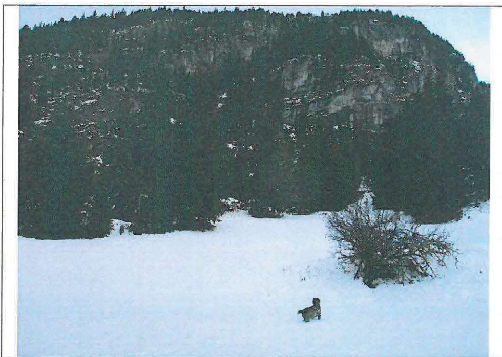
Vue en direction du Sud-Est / le 15 décembre 2020