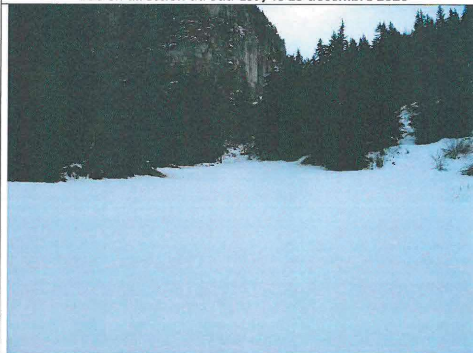
Vue en direction du Sud-Ouest / Le 15 décembre 2020