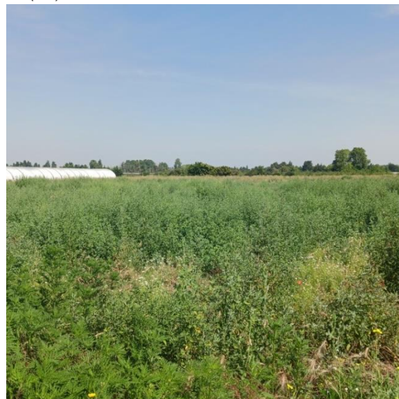
Figure 3 Friches post culturales [87.12 ; I1.53]