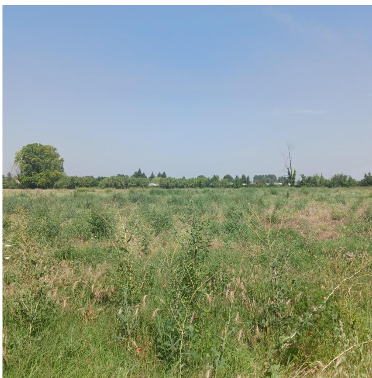
Figure1 Vue depuis la parcelle Sud

Dans ce cadre, le bureau d'études BARTH Environnement a établi un premier diagnostic visant à identifier le contexte environnemental lié aux périmètres à statuts (réglementaire et d'inventaire) et les principaux enjeux écologiques avérés et pressentis (basés sur l'analyse du patrimoine naturel avéré et potentiel). Pour cela, une visite sur site par l'expert faune/flore a été réalisée le 12 juillet 2023.