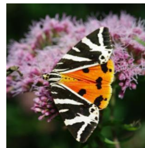
Figure 10 Agrion de Mercure – Cordulie à corps fin – Ecaille chinée