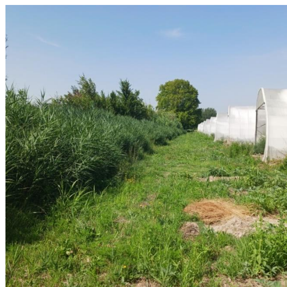
Figure 7 Roselière [53.1 ; C3.1]