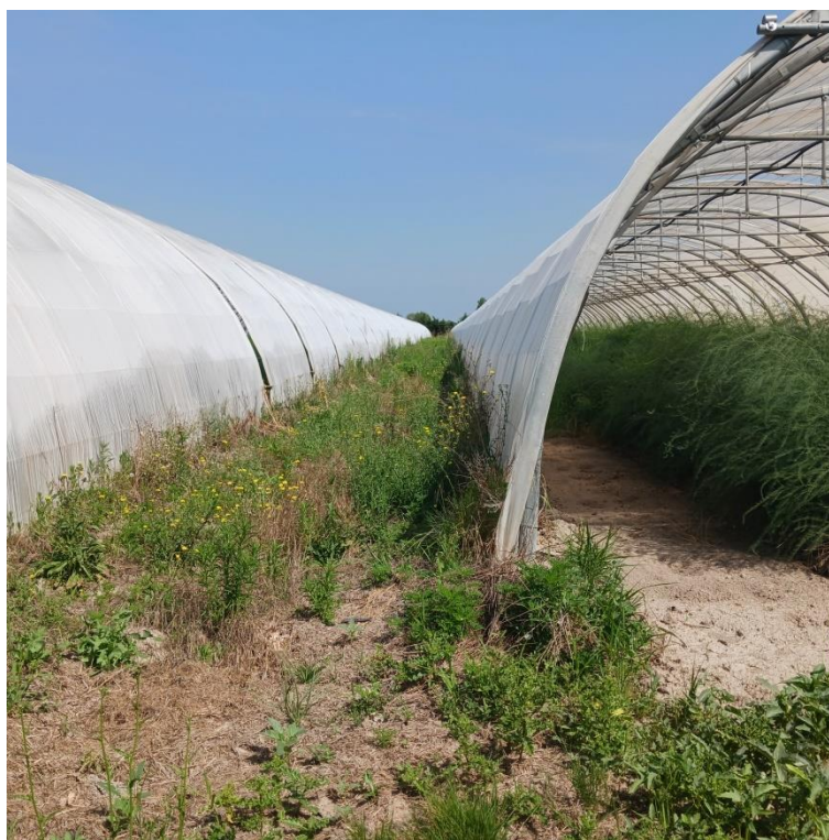
Figure 2 Espaces entre les serres

De plus, l'Architecte désigné par le porteur de projet, veillera à l'optimisation du nouvel aménagement dans l'espace et à son orientation. Les haies actuelles ne seront pas modifiées ou détruites.