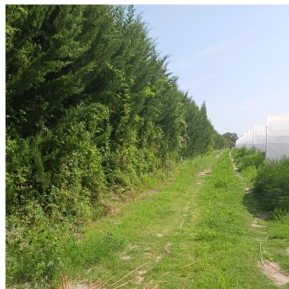
Figure 5 Haie de Cyprès [84.1 ; G5.1]