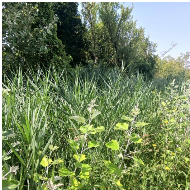
Figure 8 Haie arborée longeant le Canal d'irrigation [84 ; G5]