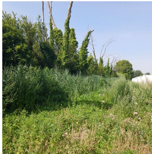
Figure 9 Haie arborée longeant le Canal d'irrigation [84 ; G5]