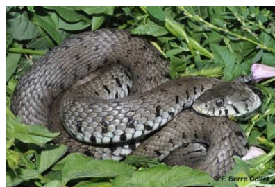
Figure 12 Couleuvre de Montpellier et Couleuvre à collier