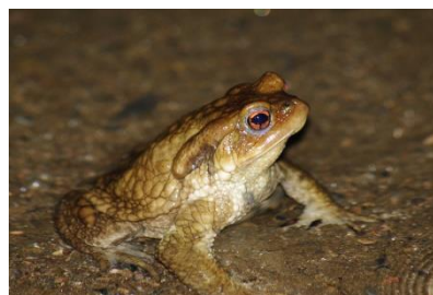
Figure 11 Rainette méridionale et Crapaud épineux