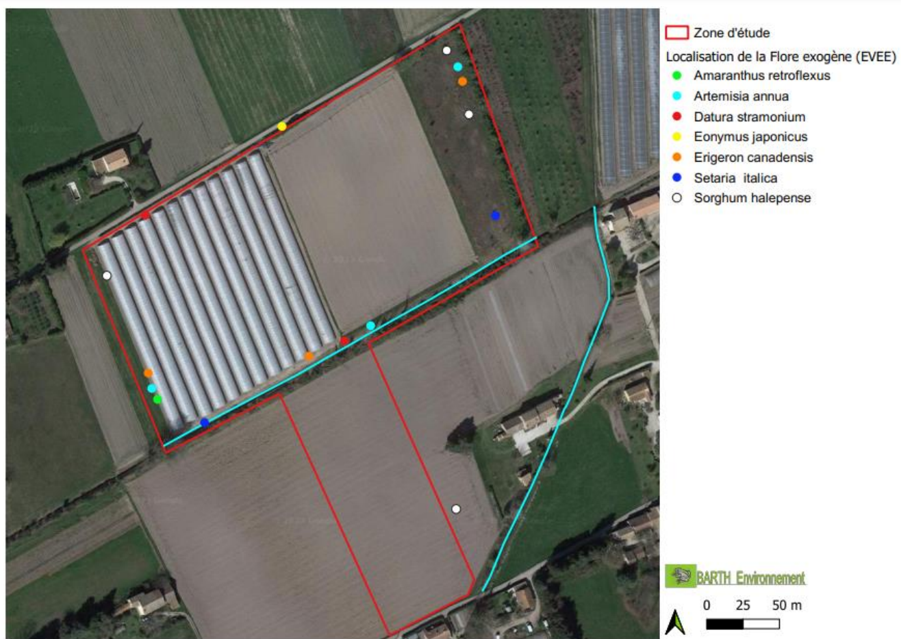
Carte 5 Localisation des Espèces Végétales Exotiques Envahissantes (EVEE) et potentiellement envahissantes (EVEPotE)