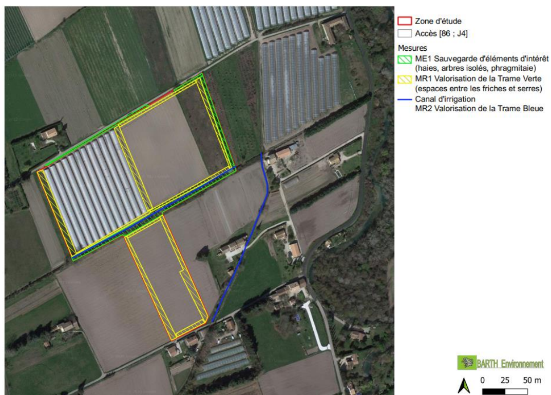
Carte 3 Localisation des Mesures Environnementales