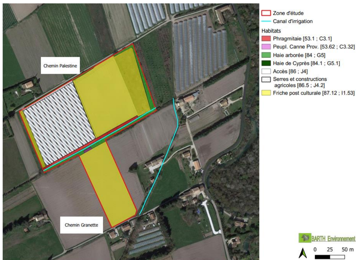
Carte 2 Typologie d'habitats semi-naturels

Les habitats de la zone d'étude sont typiques de la matrice paysagère avignonnaise. Cependant la diversité et la qualité des milieux ne permettent pas le maintien d'un cortège intéressant d'espèces animales d'intérêt communautaire, ni d'espèces végétales rares. La typologie des habitats est présentée dans la carte ci-après :