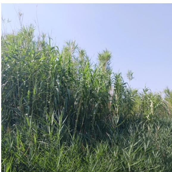
Figure 6 Peuplement de Cannes de Provence [53.62 ; C3.32]