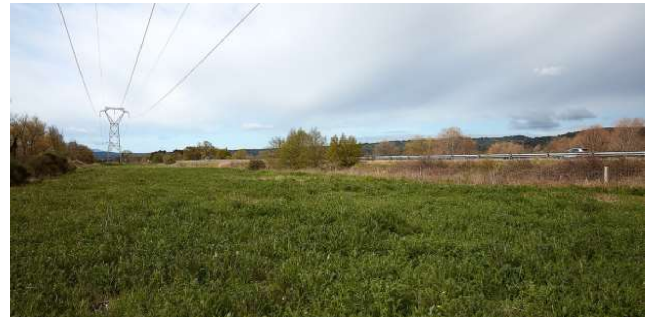
VUE ECHELLE RAPPROCHEE NO 6 : EN DIRECTION DU SUD.

La bande de roulement de l'autoroute est surélevée d'environ 1 m par rapport au terrain sur ce secteur.