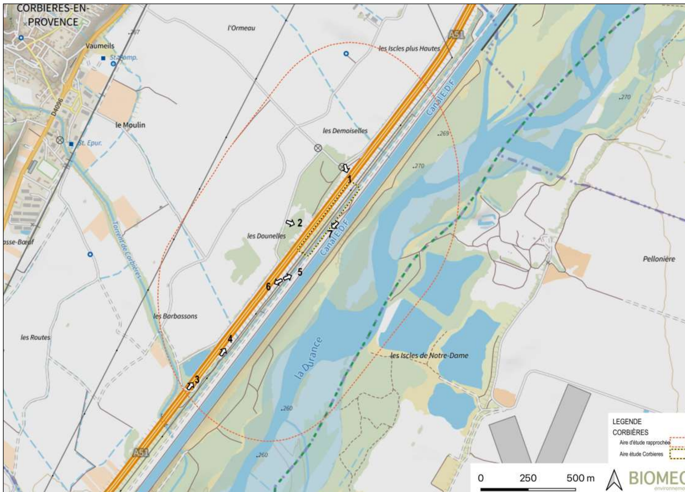
FIGURE 22 : LOCALISATION DES VUES.