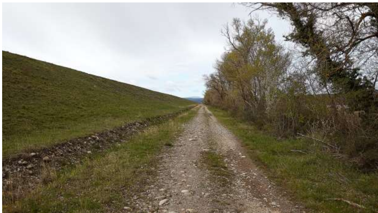
VUE ECHELLE RAPPROCHEE NO 7 : EN DIRECTION DU SUD.

On note le dénivelé d'environ 6,00 mètres entre le chemin et la ligne de crête du talus.