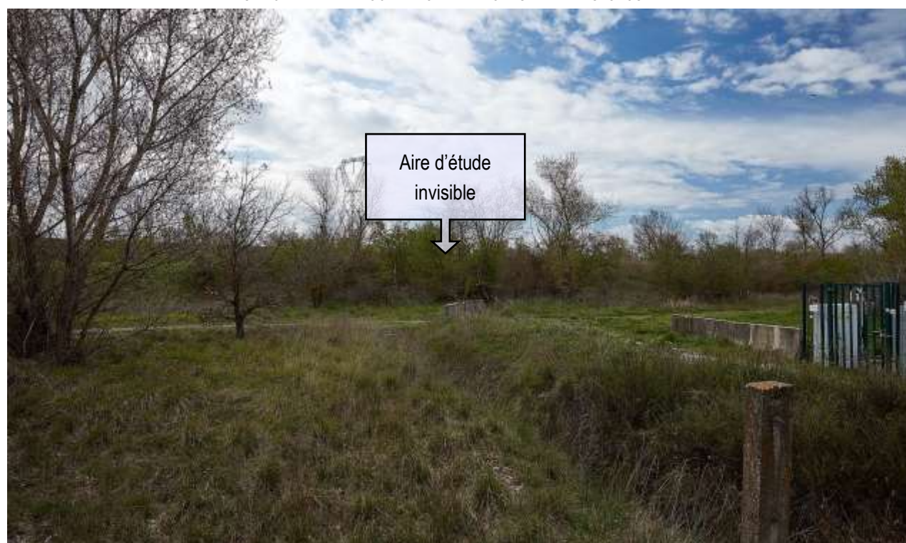
VUE ECHELLE RAPPROCHEE NO 1 : EN BORDURE DE L'AUTOROUTE.

Le point de vue en léger contrebas de l'autoroute ne permet pas d'observer l'aire d'étude immédiate, elle aussi située légèrement plus bas que la chaussée autoroutière.