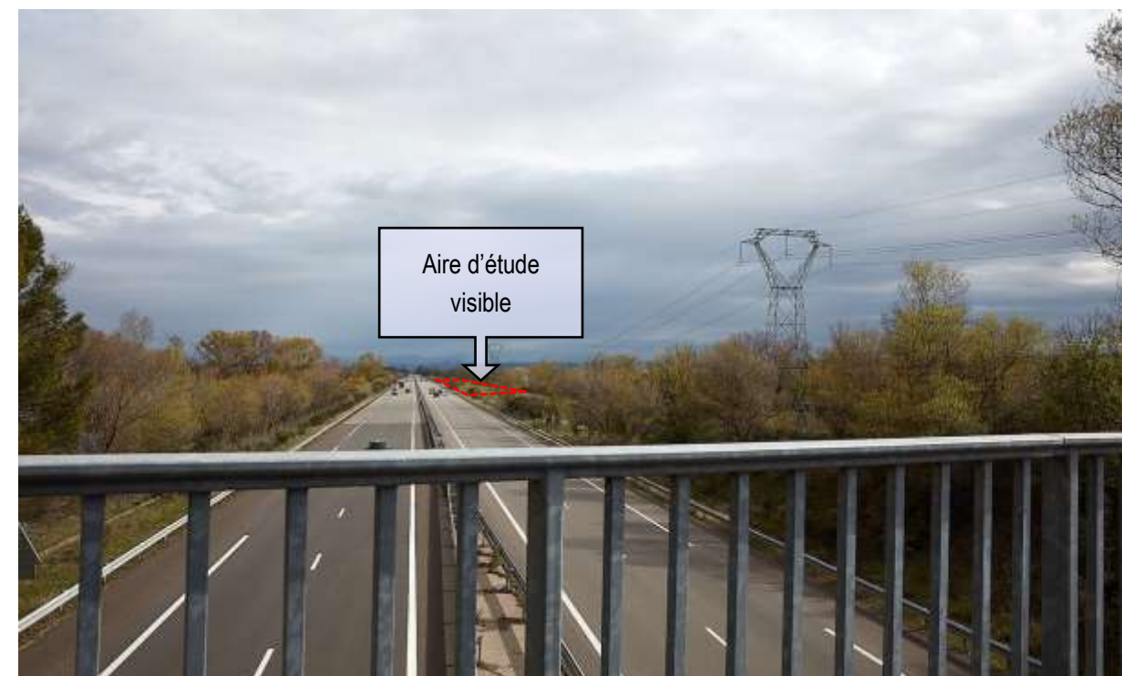
VUE ECHELLE RAPPROCHEE NO 3 : DEPUIS LE PONT.

L'aire d'étude immédiate est légèrement visible depuis ce point de vue en surplomb.