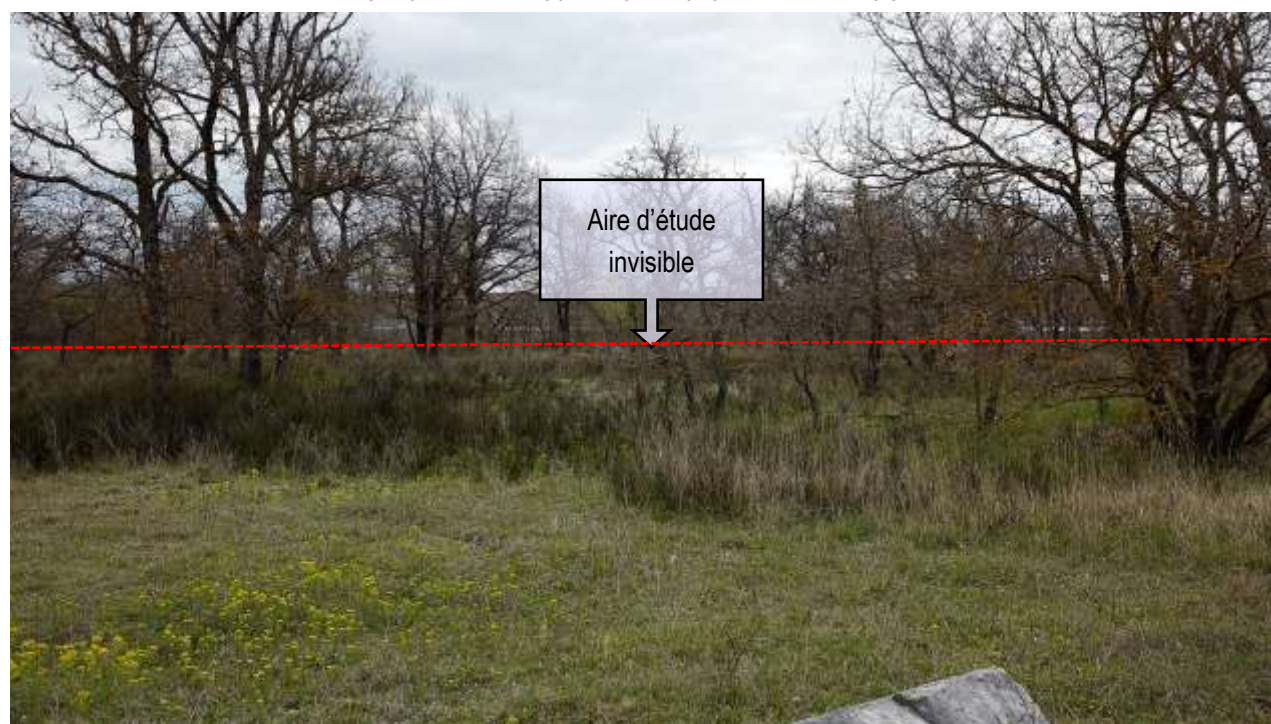
VUE ECHELLE RAPPROCHEE NO 2 : LONGEANT LE PETIT BOIS.

On distingue faiblement la chaussée de l'autoroute. L'aire d'étude immédiate n'est pas visible. Mais le haut des panneaux sera perceptible derrière des arbres de premier plan.