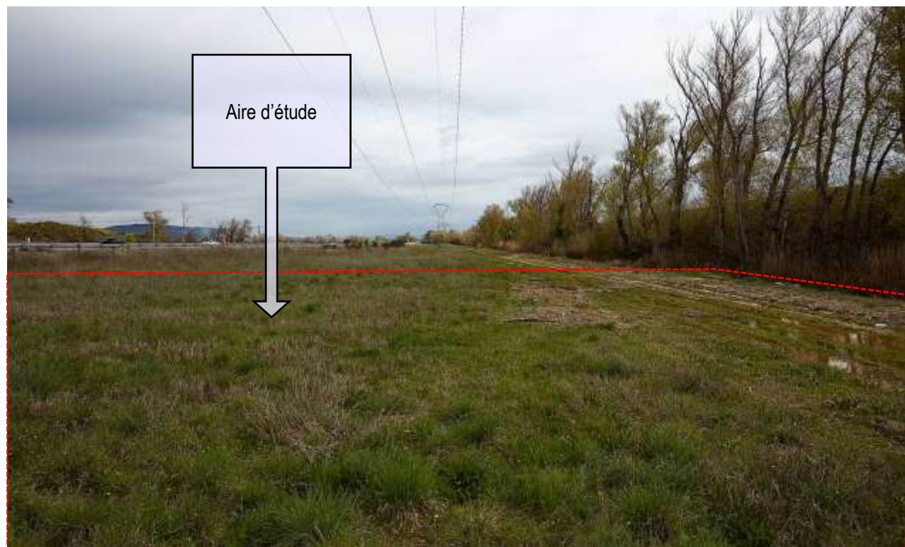
VUE ECHELLE IMMEDIATE NO 2