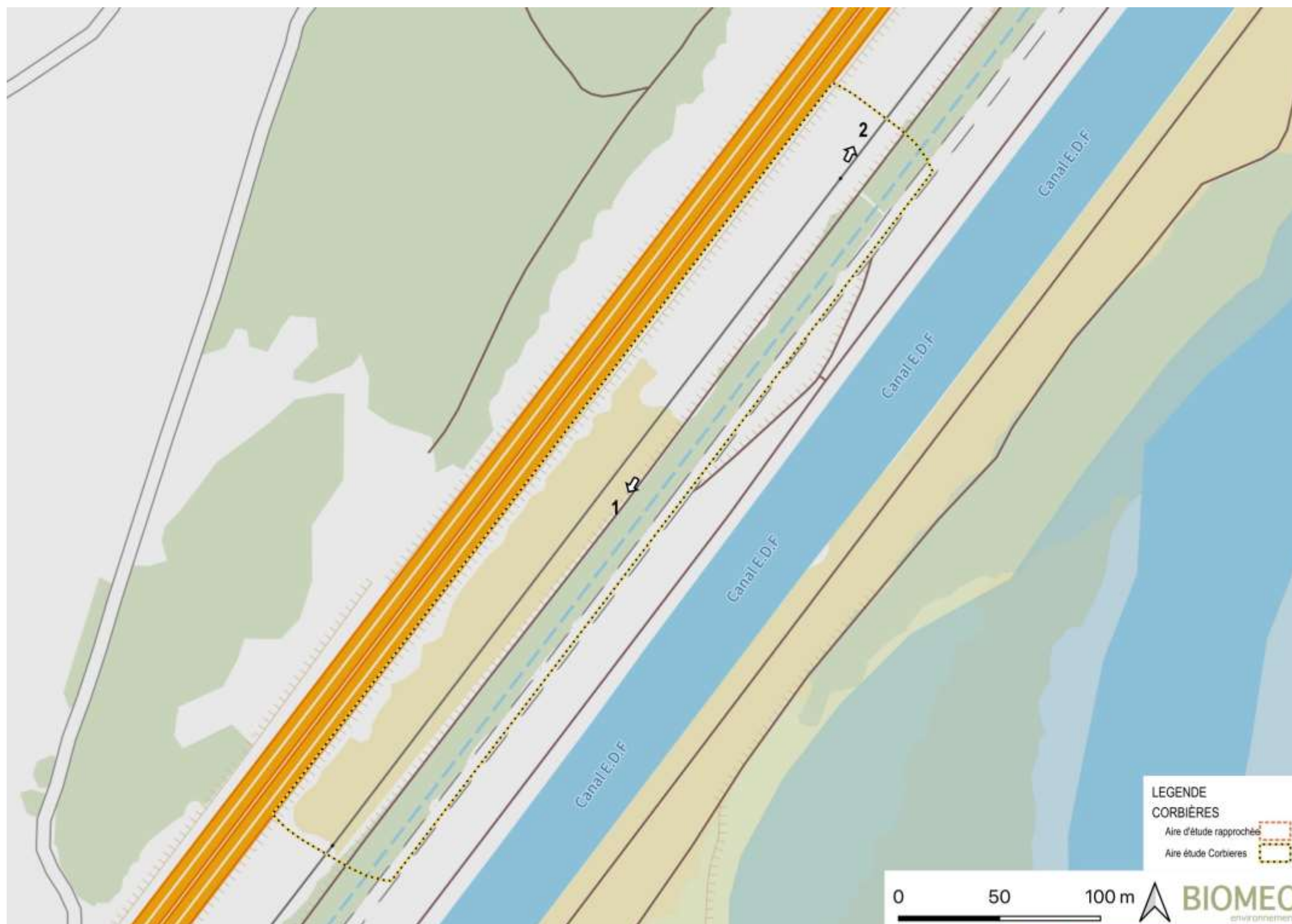
FIGURE 24 : LOCALISATION DES VUES IMMEDIATES.