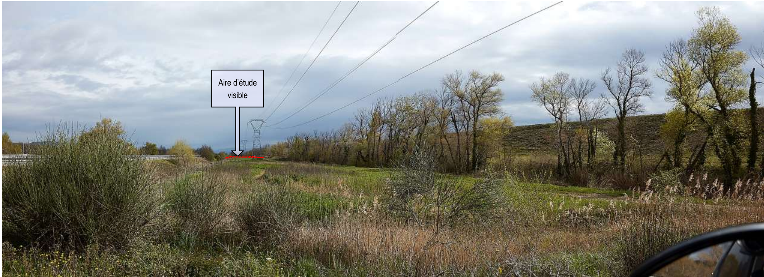
VUE ECHELLE RAPPROCHEE NO 4 : EN DIRECTION DU NORD.

L'aire d'étude est visible depuis le chemin d'accès d'au site. On notera le talus du canal, élevé d'environ 6,50 m par rapport au terrain naturel de l'aire d'étude immédiate.